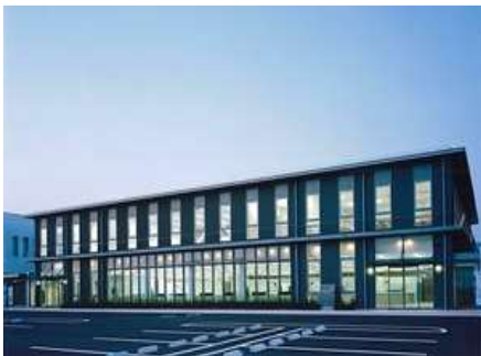
広島県自動車整備振興会事務所

所在地 広島市中区鶴見町 用途 教会 保育所 事務所 変電所 構造 鉄骨造 規模 地上 10 階建 延床面積 11,678.48 ㎡