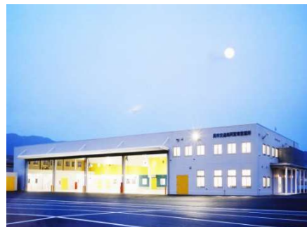
呉市交通局阿賀南営業所

所在地 広島市西区観音新町 用途 事務所 構造 鉄骨造 規模 地上 3 階建 延床面積 3,353.90 ㎡