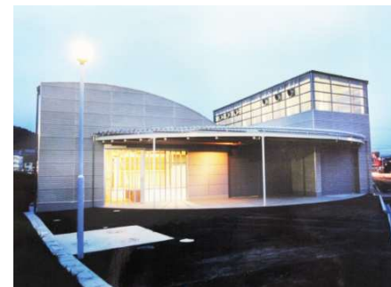
酒蔵住田屋西条店

所在地 広島市阿賀南 用途 事務所・整備工場 構造 鉄骨造 規模 地上 2 階建 延床面積 1,739.55 ㎡