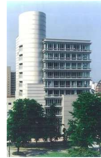
ルーテル平和大通りビル 日本福音ルーテル教会

所在地 広島市中区鶴見町 用途 事務所 駐車場 構造 鉄骨造 規模 地上8階 地下1階建 延床面積 2,680.98 ㎡