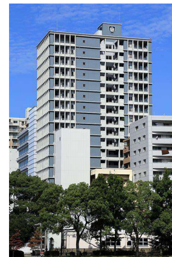
ハウスバンフリース平和大通り

所在地 広島市中区平野町 用途 共同住宅 構造 鉄筋コンクリート造 規模 地上 10 階建 延床面積 1,288.91 m 2