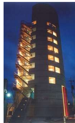
PAST PARK SIDE TOWER

所在地 広島市南区上東雲 用途 共同住宅 構造 鉄筋コンクリート造 規模 地上 5 階建 延床面積 391.5 m 2