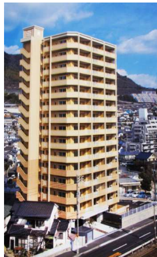
ヴェルディ井口駅前

所在地 広島市中区上幟町 用途 駐車場 共同住宅 構造 鉄筋コンクリート造 規模 地上 4 階建 延床面積 354.95 ㎡