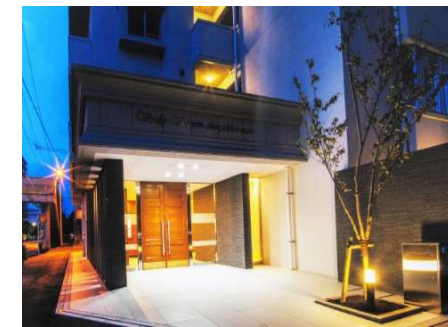
ヴェルディ観音小学校前

所在地 広島市中区江波西 用途 共同住宅 構造 鉄筋コンクリート造 規模 地上 13 階建 延床面積 3,389.52 ㎡