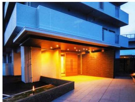
ヴェルディ江波リバーフロント

所在地 広島市南区日宇那町 用途 貸事務所兼用住宅 構造 鉄筋コンクリート造 規模 地上 3 階建 延床面積 156.27 ㎡