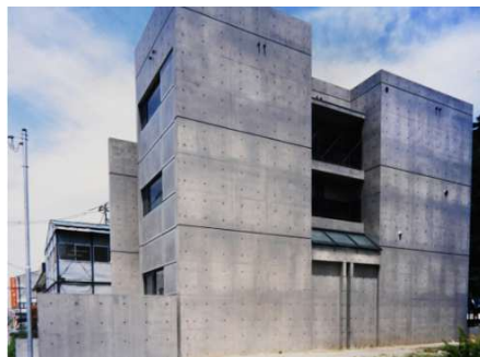
カメイ日宇那ビル

所在地 広島市西区南観音 用途 共同住宅 構造 鉄筋コンクリート造一部鉄骨造 規模 地上 5 階建 延床面積 1,202.70 ㎡