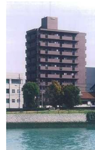
藤和ハイタウン比治山

所在地 広島市安芸区矢野西 用途 貸事務所 共同住宅 構造 鉄筋コンクリート造 規模 地上 5 階建 延床面積 639.59 ㎡