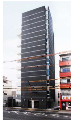
MARIO TERRACE 平野町

所在地 広島市中区銀山町 用途 共同住宅 構造 鉄筋コンクリート造 規模 地上 12 階建 延床面積 1,321.73 m 2