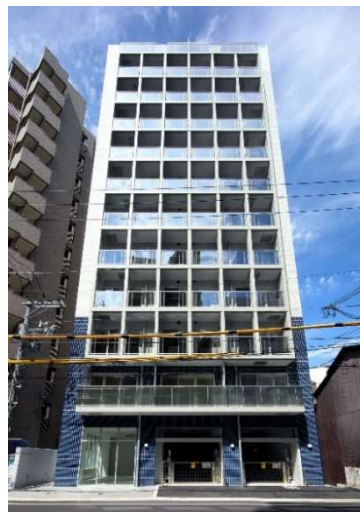
銀山町マンション

所在地 広島市中区東白島 用途 共同住宅 構造 鉄筋コンクリート造 規模 地上 13 階建 延床面積 1,633.33 m 2