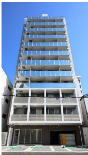
アーバングレース広島

所在地 広島市中区東白島 用途 共同住宅 構造 鉄筋コンクリート造 規模 地上 13 階建 延床面積 1,633.33 m 2