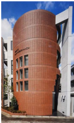
フレスコ上幟町(江盛ビル)

所在地 広島市中区上幟町 用途 駐車場 共同住宅 構造 鉄筋コンクリート造 規模 地上 4 階建 延床面積 354.95 ㎡