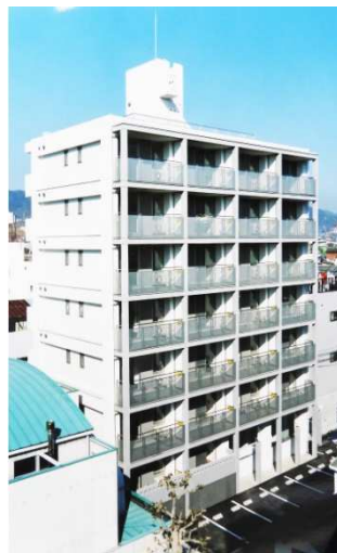
マノワール・沖田

所在地 広島市南区出汐 用途 店舗 共同住宅 構造 鉄筋コンクリート造 規模 地上 5 階建 延床面積 399.63 m 2