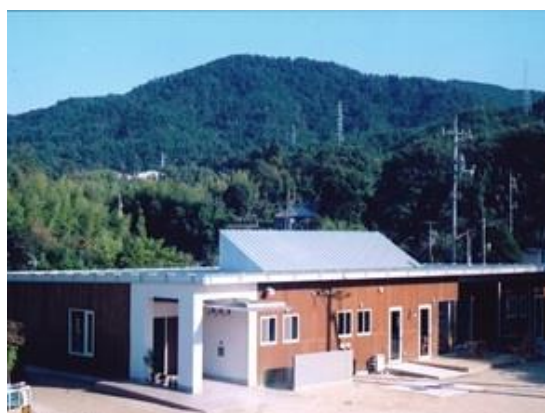
グループホームセラピス

所在地 島根県浜田市天満町 用途 医院 構造 鉄骨造 規模 地上3階建 延床面積 1,400㎡