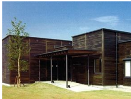
グループホームさくら

所在地 岡山県勝田郡勝央町 用途 老健施設、ケアハウス 構造 鉄筋コンクリート造 規模 地上2階建 延床面積 6,992㎡