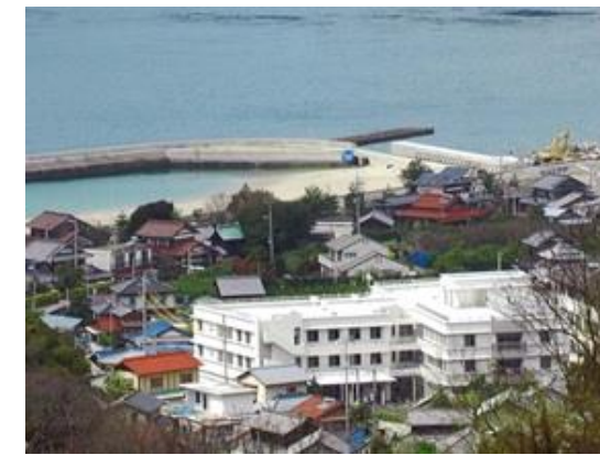
介護老人保健施設 大浜

所在地 広島県廿日市市阿品 用途 研修所 構造 鉄筋コンクリート造 規模 地下1階、地上2階建 延床面積 368㎡