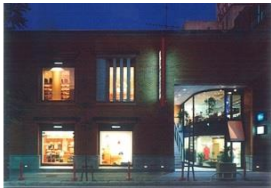
松山ミキハウスビル