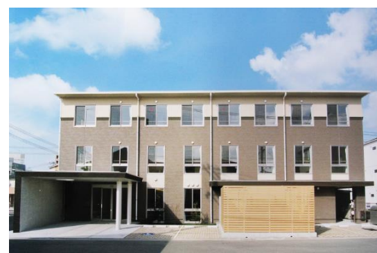
アルファリビング広島段原

所在地 広島市南区大須賀町 用途 事務所 構造 鉄骨造 規模 地上12階建PH1階 延床面積 2,136.49㎡