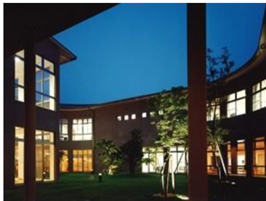
勝央町総合福祉センター

所在地 岡山県勝田郡勝央町 用途 老健施設、ケアハウス 構造 鉄筋コンクリート造 規模 地上2階建 延床面積 6,992㎡