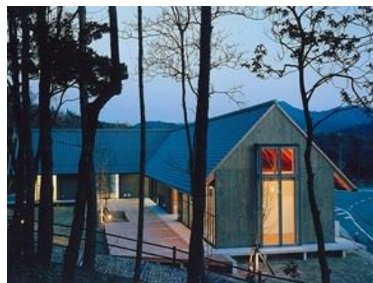
知的障害者授産施設

所在地 広島県呉市柝原町 用途 有料老人ホーム 構造 鉄骨造 規模 平屋建 延床面積420㎡