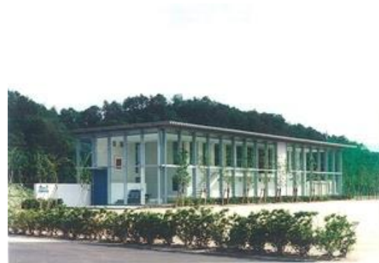
東友会健康保険組合総合 グランドクラブハウス

所在地 広島市東区牛田東 用途 住宅 構造 鉄筋コンクリート造 規模 地上2階建 延床面積337.88㎡