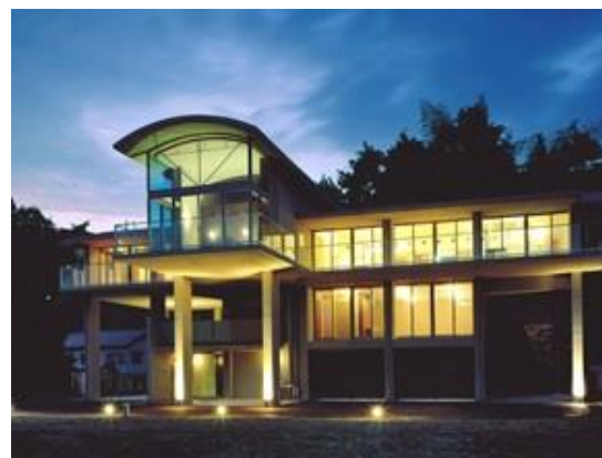
玖珂クリニック研修所

所在地 島根県浜田市金城町 用途 知的障害者授産施設 構造 木造 規模 平屋建 延床面積 270㎡