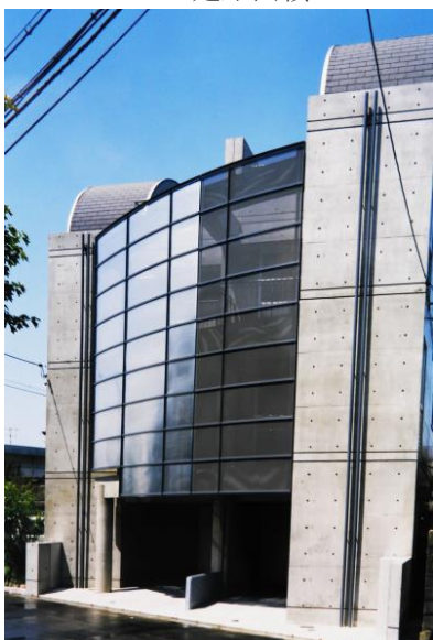
カメイ庚午南ビル

所在地 広島市南区出汐 用途 店舗 共同住宅 構造 鉄筋コンクリート造 規模 地上5階建 延床面積399.63㎡