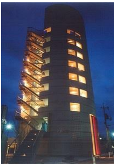
P A S T PARK SIDE TOWER

所在地 広島市南区東雲 用途 共同住宅 構造 鉄骨鉄筋コンクリート造 規模 地上9階建 延床面積845.14㎡