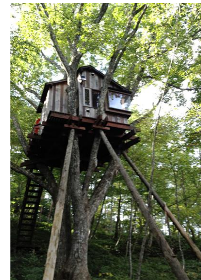
アンデルセンツリーハウス

所在地 廿日市市 用途 住宅 構造 木造 規模 地上2階建 延床面積162.27㎡