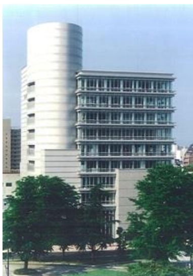
ルーテル平和大通りビル 日本福音ルーテル教会

所在地 広島市中区鶴見町 用途 教会 保育所 事務所 変電所 構造 鉄骨造 規模 地上10階建 延床面積11,678.48㎡