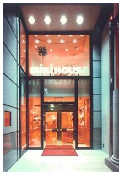
博多ミキハウスビル