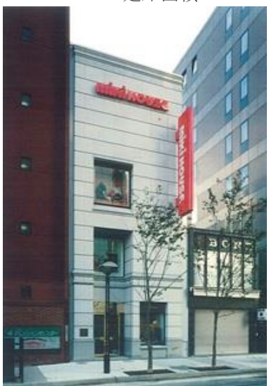
札幌ミキハウスビル

所在地 長崎県長崎市 構造 鉄骨造一部鉄筋コンクリート造 規模 地上5階 PH1階建