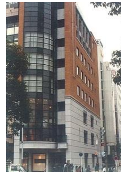
名古屋ミキハウスビル