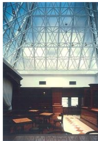
神戸ミキハウスビル