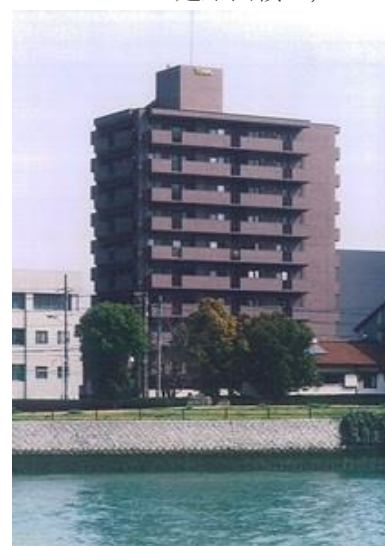
藤和ハイタウン比治山

所在地 広島市中区国泰寺町 用途 事務所 倉庫 駐車場 構造 鉄骨鉄筋コンクリート造 一部鉄骨造 規模 地上6階建て 延床面積3,851.21㎡