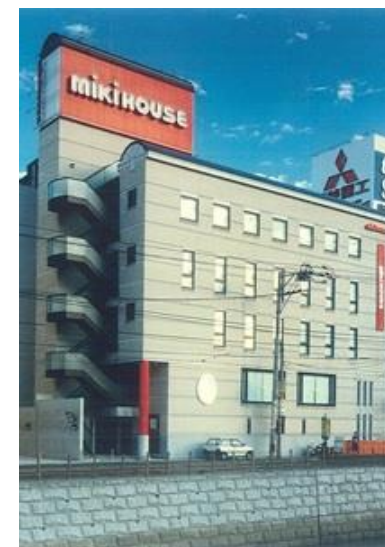
長崎ミキハウスビル

所在地 広島市東区牛田南 用途 共同住宅 構造 鉄筋コンクリート造 規模 地上10階建